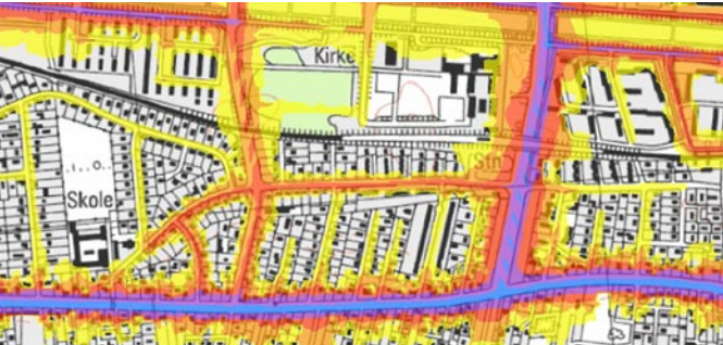
Eksempel på støjkort