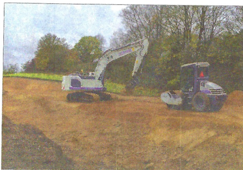
Det forberedende arbejde er for længst gået i gang.

Togværkstedet ved Næstved er ét af tre, som skal bygges til at servicere de nye og længere el-tog, som de kommende år erstatter de nuværende tog. De øvrige værksteder skal opføres i Aarhus og København.